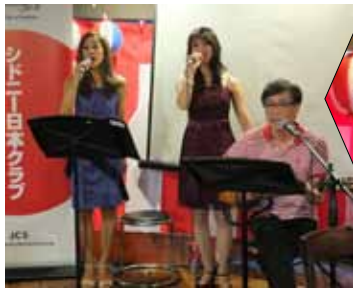
懐かしの歌を披露するJCS 2016 EYPスペシャルユニットの3人組