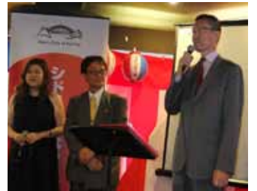
水越会長の開会の挨拶