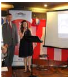
JCS今年1年を振り返るスライド上映。今年も数多くの活動がありました。皆さまご苦労様でした。