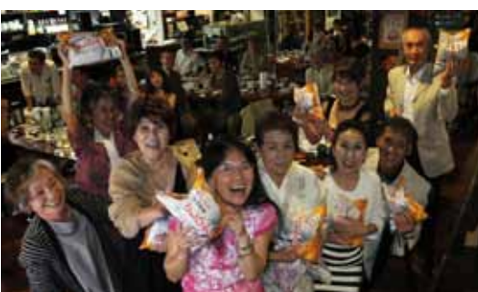
テーブル対抗トリビアクイズは、昨年に続いて「親睦の会」が優勝しました。賞品のお米を手を喜び会員の皆さん。