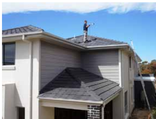
TVも観れるようになった

いいね、こういうの。一堂に会して一気に物事を片付けていく様を見ているのは、気持ちいい。