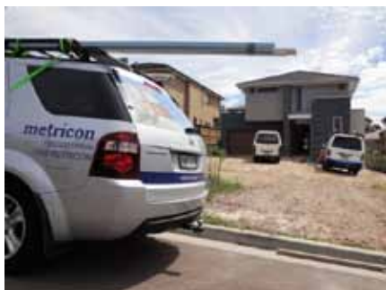
関係者が続々と乗り付ける

引っ越しが終わっても内装の一部は未完成のまま、翌日にはキッチンの吊り戸取り付け屋・ドアの隙間を埋めたりする大工さん・ペンキ屋・TVアンテナ屋、そしてアレンジャーのSite Managerと続々集まってきて、さながら関係者全員集合状態。