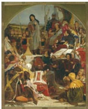
Ford Madox Brown Chaucer at the court of Edward III (1847-1851)

この作品は、当美術館が開館間もない1876年（明治8年）にBrownから直接大枚500ポンド（その頃の年間予算のほとんど）で購入した最初の大作で、美術館における重要な作品の一つです。また、この絵とまったく同じ絵が、ロンドンのテート美術館にあり、2010年7月にロンドンを訪れた際にそれを見てきたのですが、まったく同じ絵でありながらスケールの小さいその作品を見て、我が美術館の作品がいかに大作かを確認しました。今回の特別展は、Brownのこの大作制作準備のためのスケッチ、下絵、習作5点を含み、1876年以来、これらがシドニーで初めて会することになります。