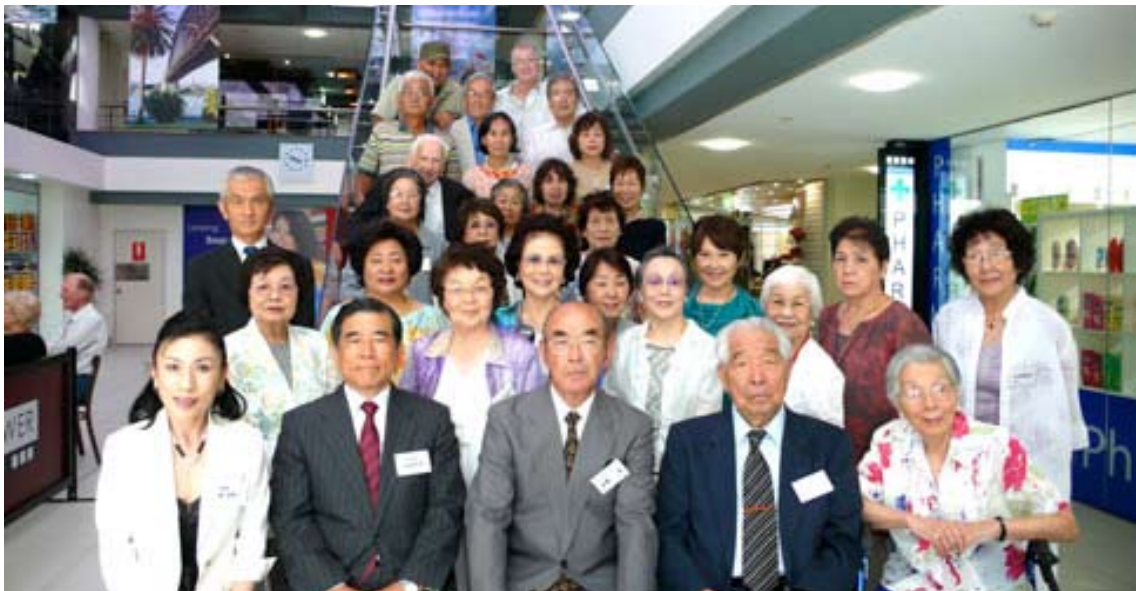
新年会に参加したみなさん