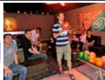
幹事ご苦労様でした！