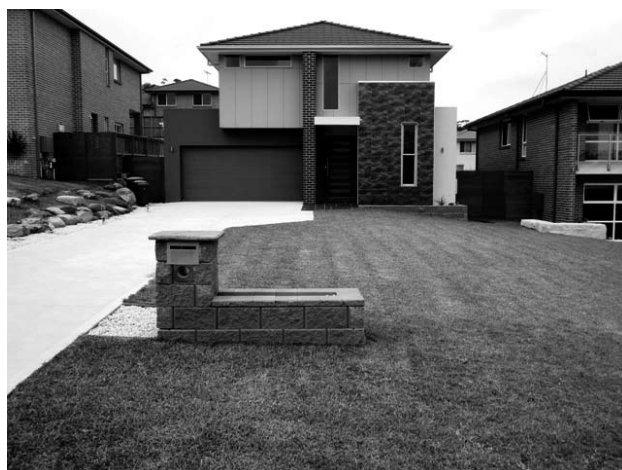
【写真上】2008年6月、土地購入直後。