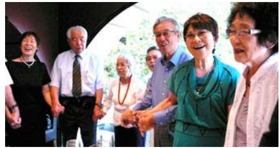
会員みんなで手をつなぎ合い、一丸となって日本の懐かしい歌を合唱しました。

一人ずつ自己紹介と短いコメントを話してもらい、より一層親睦を深めました。また1月生まれの方々に