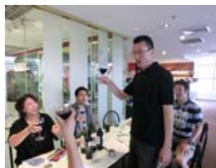
最後に全員で集合写真