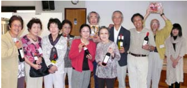
ビンゴが当たって嬉しい笑顔のみなさん。おめでとうございます。