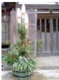
玄関横に置かれた正月を祝う門松

これから、一戸建ての玄関では、この話を思い出して敬意を表して通過させて頂くよう心がけて下されば幸甚です！ 合掌