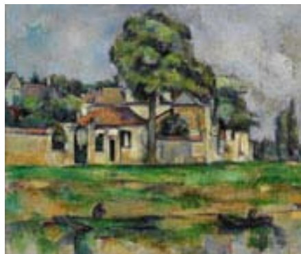
Paul Cézanne Banks of the Marne (1888)

州立美術館が2008年に、館長就任30周年と美術館基金の創設25周年を記念して、オーストラリアの公立美術館として最高額で購入したセザンヌの風景画、「Banks of the Marne, 1888」。ピカソをして、“私のたった一人の唯一の師匠、私の父とも言える”と言わしめたセザンヌのパッチワークのような風景画に1910年初めに現れてくるキュービズムの萌芽が見られます。