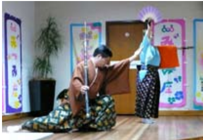
日本舞踊「橋弁慶」京の五条の橋の上、牛若丸と弁慶の大殺陣回りは、お見事でした。

演目は、「橋弁慶」「花笠音頭」「黒田節」「ソーラン節」「南部坂雪の別れ」「静かなる光」「夢幻響」「ミツミズム」「フェスタ」でした。