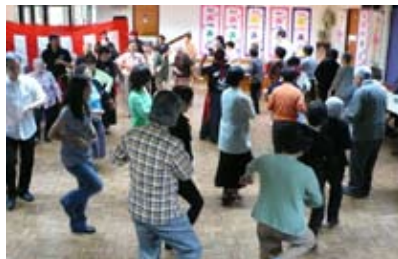
心ひとつに輪になって「炭鉱節」を踊りました。楽しい楽しいひと時でした。

公演後は、歓談と交流の時間を設け、楽しいおしゃべりが続きましたが、残念ながら時間となってしまいました。それでも演芸団も会員も帰ろうと