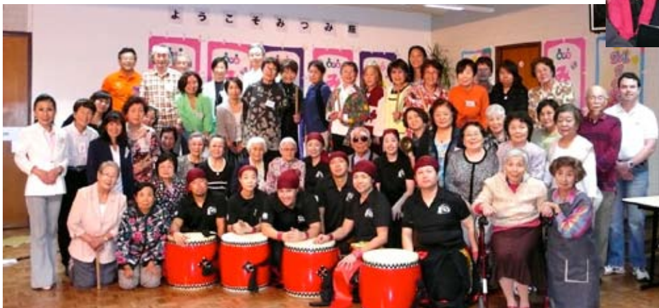
福岡県福岡市の「みつみ座」の演芸団と親睦の会の会員。またきつといらしてね！再会を約束しました。

せず、なかなか御開きにはなれませんでした。そこで「別れ～ることは辛い～けど♪♪♪」と歌いながら、みんなで大きく手を振り合って演芸団を見送りまし