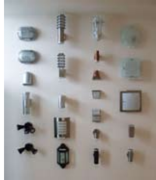
Builderのショールーム、こんな感じで照明展示中。

Linen(物置き)やWalk-In-Closetには、「引っ越したあとに自分らで好みのヤツつけるから、とりあえず裸電球でいっす」としてコストセーブしたはいいが、今日に至ってもそのまま裸電球が活躍中。