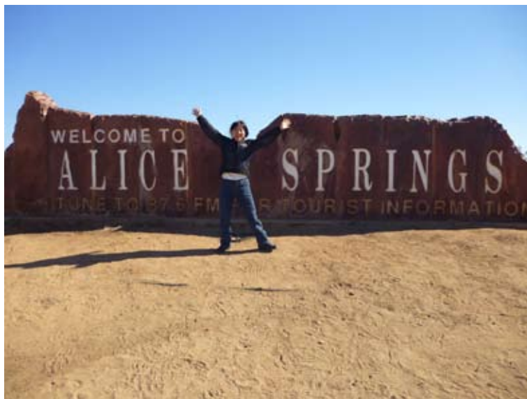
ついに来たぞー！アリス Springs

ところで、このノーザンテリトリーの砂漠の1本道 Stuart Highway沿いにあるガソリンスタンドでは、これ