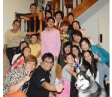
メンバー宅で懇親会を開催

4月はイベントがなく、スクールホリデーのため学校での練習もお休みでした。その代わりに、4月11日(土)にソーラン踊り隊の親睦会を、メンバーの自宅で行ないました。参加者持ち寄りの料理と、手作りのたこ焼きを頂き、大いに親睦・交流を深めました。今月は例年参加しているBuddha's Birthday Festival(9日)、鯉の品評会(17日)などでパフォーマンスします。今年も数々のイベントに参加して、日本の踊りを披露していきます。皆さん応援よろしくお願いします。もちろん一緒に踊りたい方、大歓迎です！