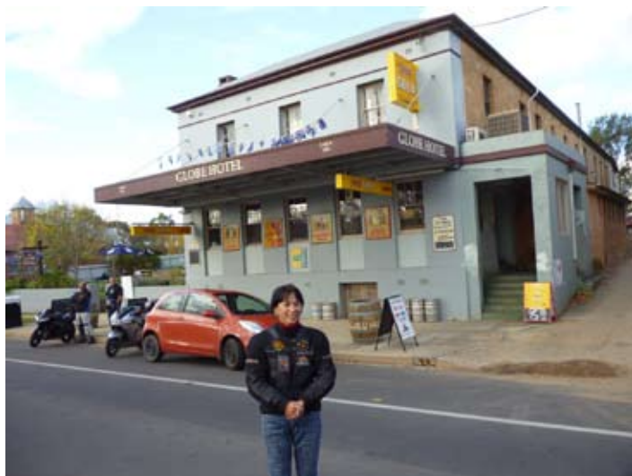
私達が泊まったホテル兼パブ

私達バイク族が泊まる場所は、綺麗なキャビンやモーテルの時もあるが、今回はパブの二階がホテルという、飲ん兵衛にはもってこいのスーパーバジェットのホテルだった。ここのメリットは、一に安い、二に、部屋は二階だから、運転の心配をせずに思い切り飲めるといこと。デメリットは、シャワー、トイレが共同、部屋にはベッド以外何もないということである。ホテルの料金と質は、常に正比例していることをまたしても実感。バイク仲間との旅だからこそ、こういうホテルの経験もできるというもので、アリス・スプリングスで経験した地下牢のようなホテルを思えば、立派なものだ。ありがたや、ありがたや。