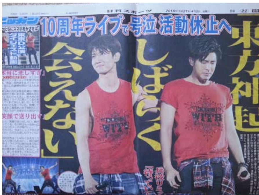
ライブ翌日、東方神起の活動休止を伝えるスポーツ紙

ところで、第二次世界大戦後に分断された国の中で、南北ベトナムも東西ドイツもとっくの昔にひとつの国になったのに、朝鮮半島では今も南北の分断が