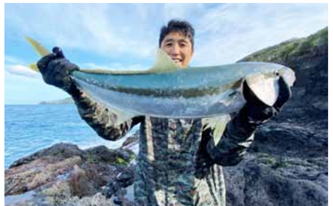
平政(キングフィッシュ)はその引きがたまらない。

島に都合6泊し、7日目に再度パッキング。別れを告げてダッシュ8に乗り込んだ。しかし今度は機体の故障により、またもや延泊に。何か島から出ないように言われているような気にもなりつつ、今一度釣り道具を取り出し、8日目には滞在中3尾目の、90cm弱の平政をゲット。ここで釣った魚は食べることはできても、外には持ち出せないルール。これらは地元の貴重な食材になる。