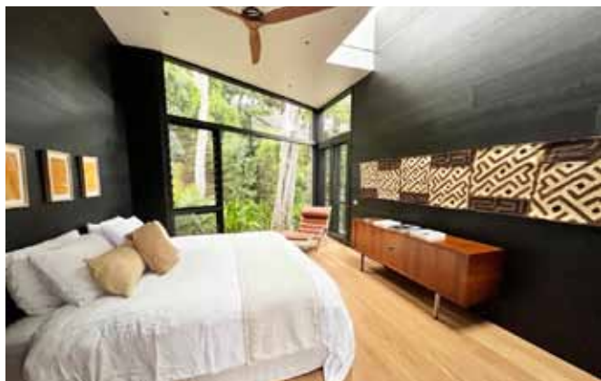
宝石のような宿については、連絡いただければ詳細をお伝えします。

「僕ら」というのは、ピザの件で呼ばれたのは僕一人なのだけど、結局家族が4人ついてきたので、5人での渡航となった。材料として小麦粉、トマト缶とチーズ、それに相当数の保冷剤を数十キロ持ち込んでいるので、オーバーウエイトを考えれば、結果として都合が良かった。